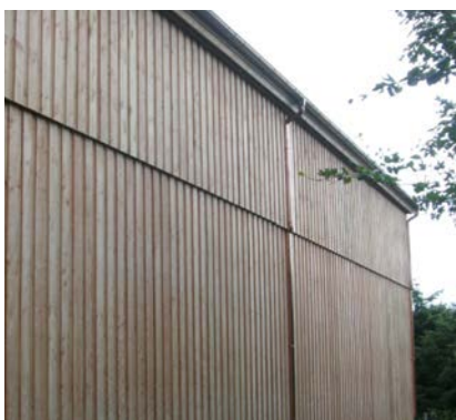
Abb. 5: Halle von außen mit Lärchenholzverkleidung in Boden-Deckel-Schalung

sich auf sechs Monate. Bei noch strafferer Organisation wären auch fünf Monate machbar gewesen. Nach Fertigstellung wurden die Innenseiten der Edelstahltanks gebeizt. Durch das Beizen werden Anlauffarben im Bereich von Schweißnähten und sonstige Verschmutzungen sicher entfernt und die ursprüngliche Korrosionsbeständigkeit des Edelstahls wieder hergestellt. Diese beruht auf der Bildung einer Schicht aus Chrom-Oxid (sogenannte Passivschicht) in Verbindung mit Sauerstoff. Je höher der Chrom-Anteil eines Edelstahls, desto höher ist seine Korrosionsbeständigkeit. Nach elektrischer Installation, Einbindung der Netzpumpen, Programmierung der Steuerung (SPS) und Herstellung der Anschlüsse im Außenbereich (Zulauf, Netzeinspeisung) – diese Arbeiten wurden von den Mitarbeitern des Verbandes geleistet – ging die Trinkwasserspeicheranlage im Februar 2013 in Betrieb. Die Tabelle 1 fasst deren wesentliche Kenngrößen zusammen.