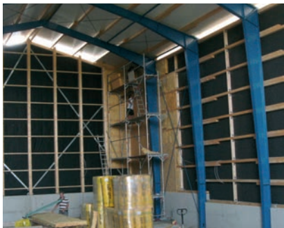
Abb. 3: Hallenbau in Stahlträgerkonstruktion mit Wandisolierung (Glaswolle)

Die Bauarbeiten am neuen Trinkwasserspeicher wurden im Februar 2012 aufgenommen und im September 2012 abgeschlossen. Die Nettobauzeit belief